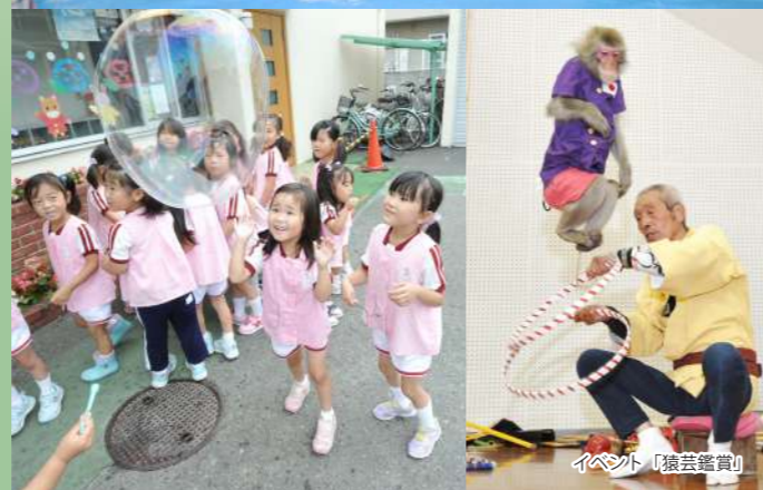
イベント「猿芸鑑賞」